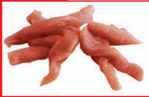
Putenbrust-geschnetzeltes bulk, tiefgefroren

Artikel-Nr. 9160 Gewicht 4 x 2,5 kg Inhalt 10 kg Lagenfaktor 5 Palettenfaktor 50 EAN-Code der Verbrauchereinheiten 40 04860 09160 0