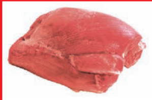
Putenoberkeulfleisch ohne Haut, ohne Knochen, tiefgefroren

Artikel-Nr. 9115 Gewicht ca. 10 kg Inhalt ca. 10 kg Lagenfaktor 5 Palettenfaktor 50 EAN-Code der Verbrauchereinheiten 40 04860 09115 0