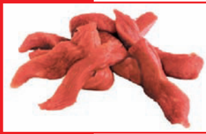
Putenoberkeulengeschnetzeltes bulk, tiefgefroren

Artikel-Nr. 9150 Gewicht 4 x 2,5 kg Inhalt 10 kg Lagenfaktor 5 Palettenfaktor 50 EAN-Code der Verbrauchereinheiten 40 04860 09150 1