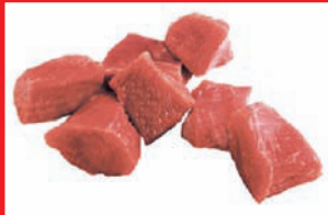
Putenoberkeulengulasch bulk, tiefgefroren

Artikel-Nr. 9160 Gewicht 4 x 2,5 kg Inhalt 10 kg Lagenfaktor 5 Palettenfaktor 50 EAN-Code der Verbrauchereinheiten 40 04860 09160 0