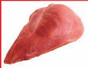
Putenbrust ohne Haut, ohne Knochen, vom Hahn, tiefgefroren

Artikel-Nr. 9161 Gewicht 4 x 2,5 kg Inhalt 10 kg Lagenfaktor 5 Palettenfaktor 50 EAN-Code der Verbrauchereinheiten 40 04860 09161 7